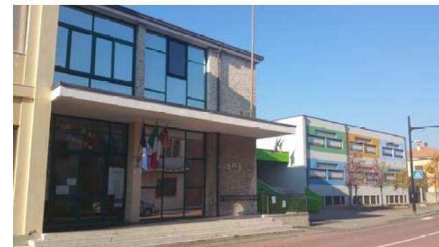
SCUOLA PRIMARIA SAN GIOVANNI BOSCO Via F.lli Stevani, 24 - Zevio